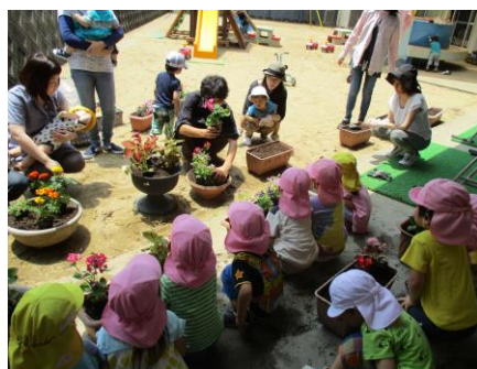
松尾農園のお兄さんと 一緒にお花を植えたよ!