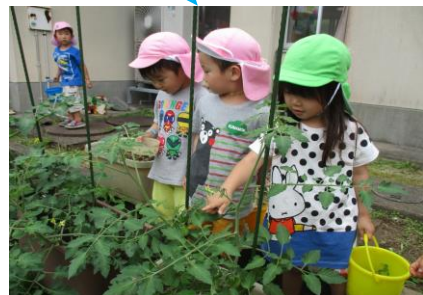
みてみて~ジャンボかぼちゃの はながさいたよ~