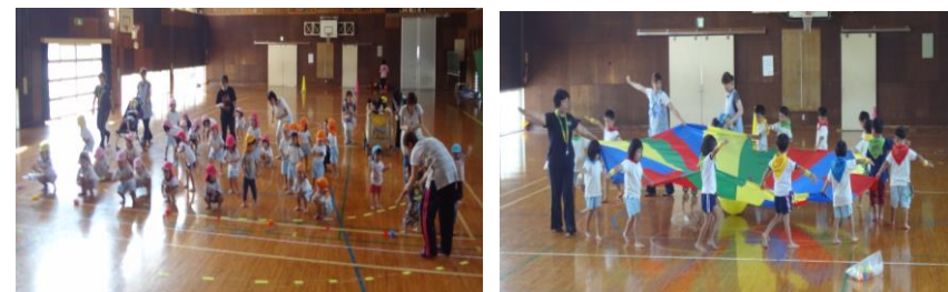
9.24 総練習での一コマ...この日はひよこぐみさんも練習に参加しました。

天気のいい日は、所庭で元気いっぱい運動会の練習を頑張ったよ! きりん・ぱんだぐみのかけっこやルールは、毎日白熱したレースが見られました。 小さいクラスのお友だちのかけっこやルールは、コースを横切ってゴールしたりと笑いの絶えない可愛い可愛い練習風景でした。